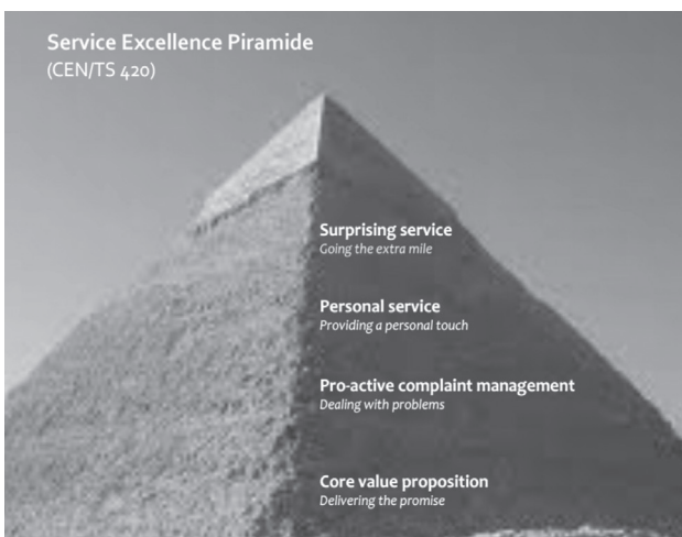
Afbeelding 2: De Service Excellence piramide

De norm onderscheidt vier service-levels die in de Service Excellence Piramide zichtbaar worden. Om te werken aan excellente service heeft een organisatie allereerst haar basisdienstverlening op orde. Aan de impliciete en expliciete verwachtingen van klanten wordt voldaan (' Delivering the promise '). Daarbij is de organisatie zo ingeregeld dat issues van klanten pro-actief worden gemanaged (' Dealing with problems '). Bovendien is de dienstverlening sterk persoonlijk zodat klanten echt contact hebben met medewerkers die echt luisteren, empathie tonen, de klant echt serieus nemen en zich persoonlijk sterk maken om hen van dienst te zijn (' Providing a personal touch '). De hoogste trede van de piramide van Service Excellence gaat over het vinden van ruimte om de verwachtingen van de klant waar mogelijk te overtreffen. Waar regels worden gebogen en waar extra inspanningen worden geleverd om de klant te helpen (' Going the extra mile ').