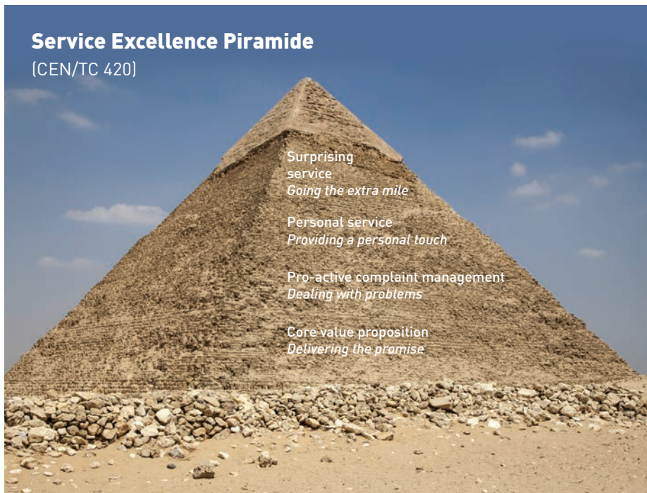
Afbeelding 3: De Service Excellence Piramide.

betekent dat elke medewerker eigenlijk ook klachtenbehandelaar is. Elke medewerker met klantcontact zal klachten moeten herkennen, écht klantgericht omgaan met klachten en moeten weten hoe een klacht op te lossen. Zo wordt klachtbehandeling onlosmakelijk onderdeel van de functie, van het werk en van de cultuur van de organisatie. Organisaties die klachtenmanagement steeds beter ontwikkelen, stappen af van de verbijzondering ervan en integreren klachtenmanagement binnen klantmanagement (customer service, customer care, customer excellence en dergelijke). Zo benadrukken ze dat omgaan met klachten en feedback van klanten 'daily customer practice' is, wat zo veel mogelijk tijdens het eerste contact op- en aangepakt wordt. Zo is bij Robeco de klachtenafdeling inmiddels opgegaan in de afdeling Customer Service.